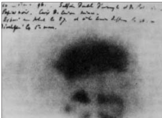
Original von Henri Becquerel: Durch Uranmineral geschwärzte Fotoplatte.

Becquerel ließ 1896 ein verpacktes Stück des uranhaltigen Minerals Pechblende in einer Schublade auf einer unbelichteten Fotoplatte liegen. Nach Tagen stellte der Forscher fest, dass die Platte ohne vorherigen Lichteinfluss geschwärzt war und die Umriss des Uranminerals zeigte. Ihm war rasch klar, dass dieser Stoff aus sich selber strahlte.